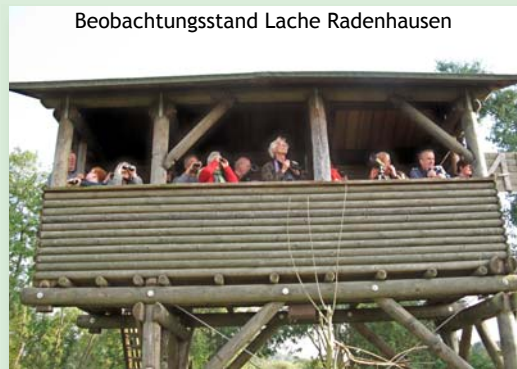
Beobachtungsstand Lache Radenhausen

Die Aufstellung des Maßnahmenplans und die weitere Betreuung vor Ort erfolgt durch behördliche Gebietsbetreuer. Die Bewirtschaftungsverträge, die z.B. Vereinbarungen über einen Düngeverzicht oder Festlegungen für späte Mahdtermine beinhalten, werden aus Mitteln des Hessischen Integrierten Agrarumweltprogramms (HIAP) gefördert. Zugleich sind auch in Zukunft gestaltende Maßnahmen, wie die Anlage von Feuchtbiotopen sowie Renaturierungsmaßnahmen an Fließgewässern, geplant.