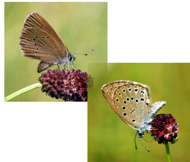
Dunkler (Maculinea nausithous; oben) und Heller Wiesenknopf-Ameisenbläuling (M. teleius; unten), jeweils Weibchen - wertbestimmende Arten des Schutzgebietes

Die beiden Schmetterlingsarten der Gattung Maculinea , zu deren Schutz das Gebiet ausgewiesen wurde, besiedeln Pfeifengraswiesen oder auch feuchte bis frische ungedüngte Mähwiesen. Voraussetzung für das ‚anscheinend konkurrenzlose Miteinander‘ ist das Vorhandensein des Großen Wiesenknopfs, der den Faltern als Nektarpflanze und zur Eiablage dient. Kolonien der Ameisenart Myrmica scabrinoides (für den Hellen Wiesenknopf-Ameisenbläuling) bzw. Myrmica rubra (für den Dunklen Wiesenknopf-Ameisenbläuling) sind für das Vorkommen der beiden Falter ebenfalls unabdinglich, da sich in deren Nestern die Larven und Puppen entwickeln. Aufgrund der Blütezeit des Wiesenknopfs sollten diese Wiesen zum Schutz der Falter von Mitte Juni bis Mitte September nicht gemäht werden.