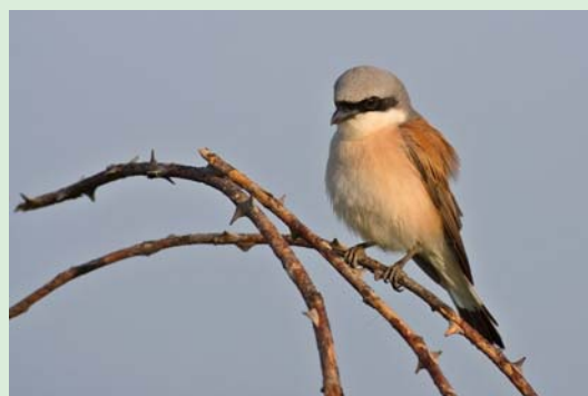
Neuntöter - angepasst an hecken- und dornenreiche Kulturlandschaft