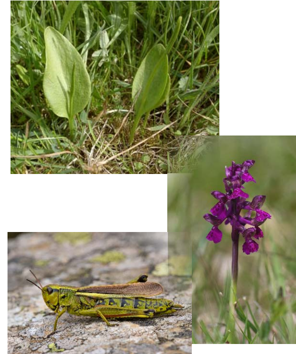
Natternzunge (oben), Kleines Knabenkraut (rechts) und Sumpfschrecke (links unten) - Vertreter magerer Mähwiesen

Die Natternzunge ist ein nur 10-20 cm hoch werdender Farn, der vor allem in lückigen Beständen von Pfeifengraswiesen vorkommt. Die Pflanze bildet meist nur ein Blatt aus, das sich in einen sporentragenden und einen nicht-sporentragenden Teil gliedert.