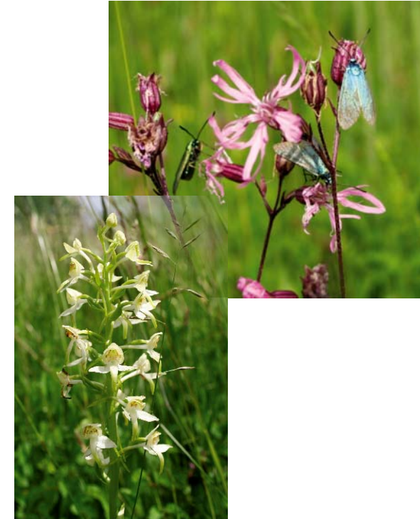
Gemeines Ampfer-Grünwidderchen (oben) und Grünliche Waldhyazinthe (unten) - Vertreter feuchterer Mähwiesen und Waldsäume

Altgrasstreifen durchzogenes Gelände mit relativ hohem Grundwasserstand. Wichtig ist eine Deckung bietende Krautschicht, die für das Braunkehlchen auch lückig sein kann und von Ansitzwarten überragt werden sollte.