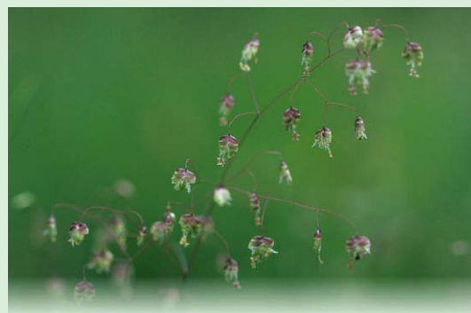
Zittergras - eine typische Art der Pfeifengraswiesen