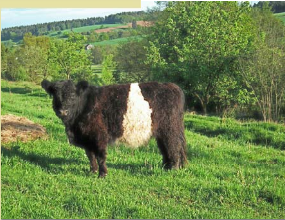
Ein ‚Pfleger‘ im Dienste des Naturschutzes